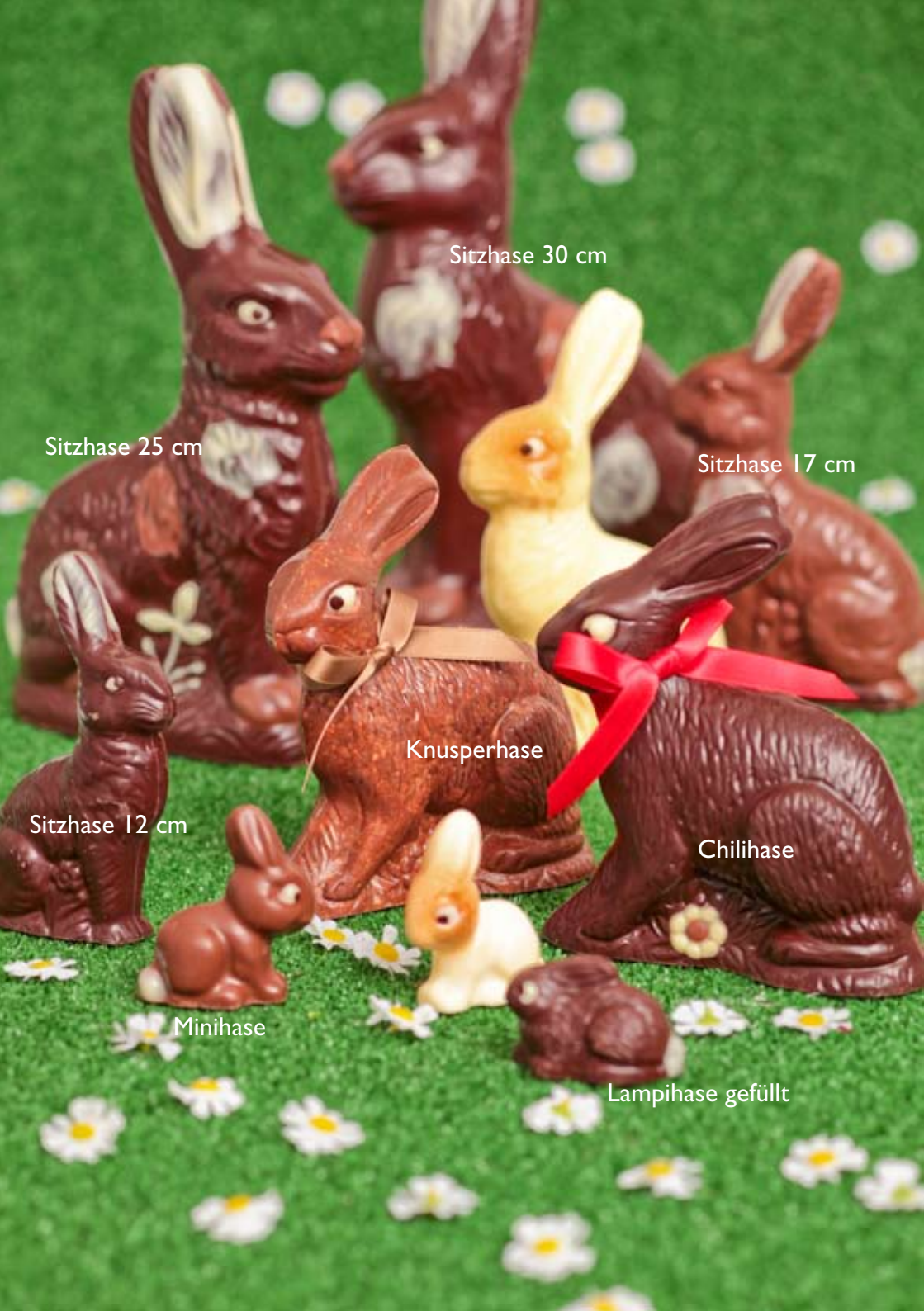
Sitzhase 30 cm