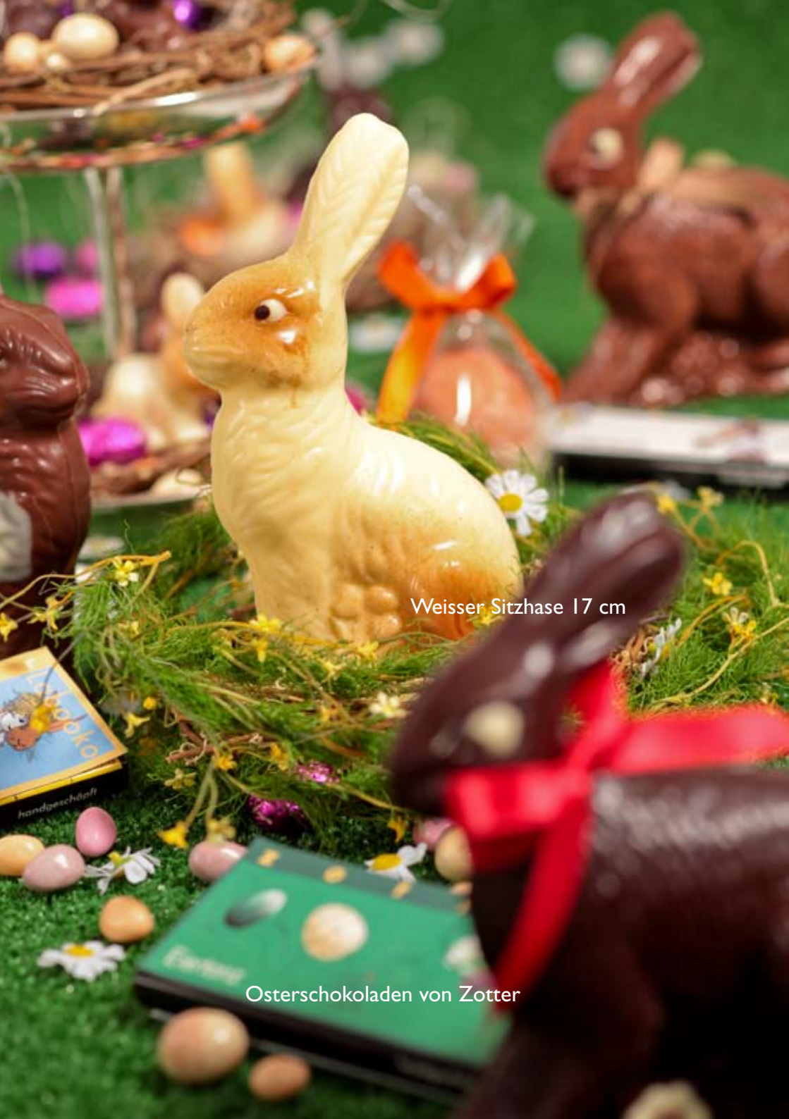
Weisser Sitzhase 17 cm