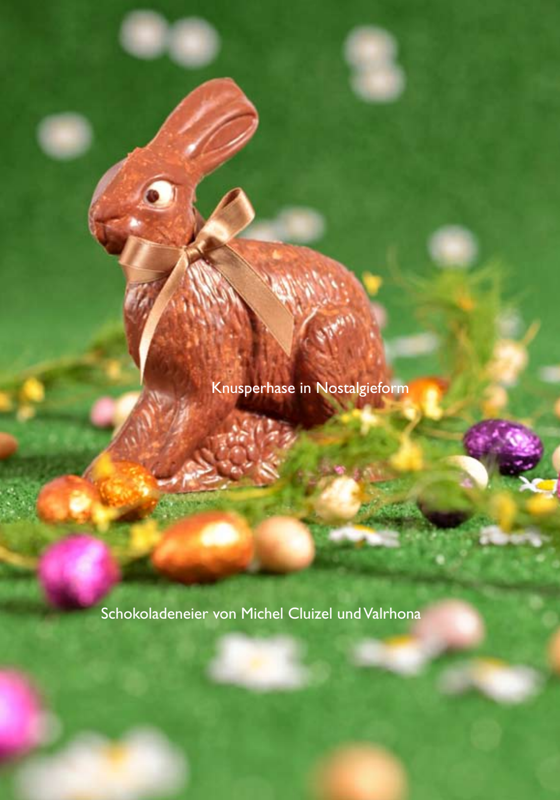
Knusperhase in Nostalgieform

Schokoladeneier von Michel Cluizel und Valrhona